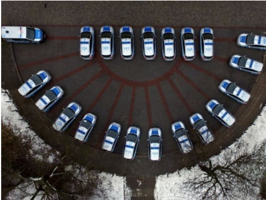
Nowe radiowozy policji zaprezentowane w grudniu