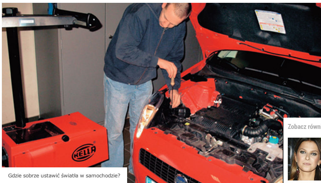
Gdzie dobrze ustawić światła w samochodzie?

W praktyce światła w samochodzie ustawia się raz w roku – podczas obowiązkowego badania technicznego. Problem w tym, że nawet w urzędowych stacjach mało kto się do tego przykład