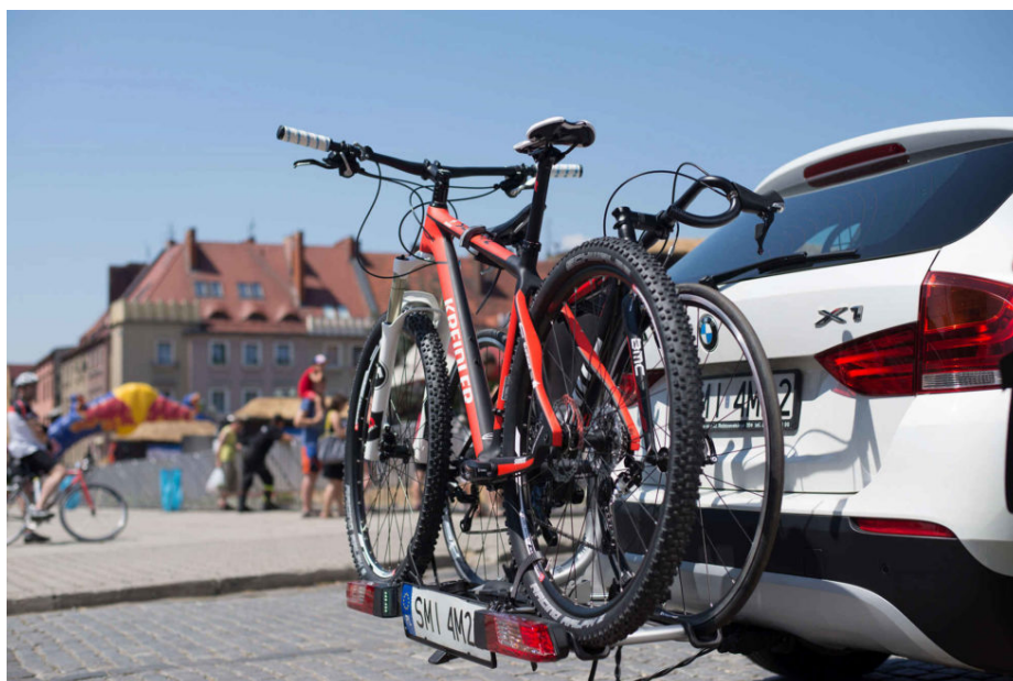
Rowerowe bagażniki na hak. Trzecia tablica legalna od 2016 roku

„W pierwszym roku obowiązywania nowych regulacji z pewnością widoczne będzie spore zainteresowanie dodatkowymi tablicami. Wdrażane zmiany dają bowiem użytkownikom pewność dotyczącą legalności użytkowania bagażników, czego niestety wcześniej nie było. Z tego powodu najprawdopodobniej wzrośnie również popyt na tego typu konstrukcje” – przewiduje ekspert firmy Taurus.