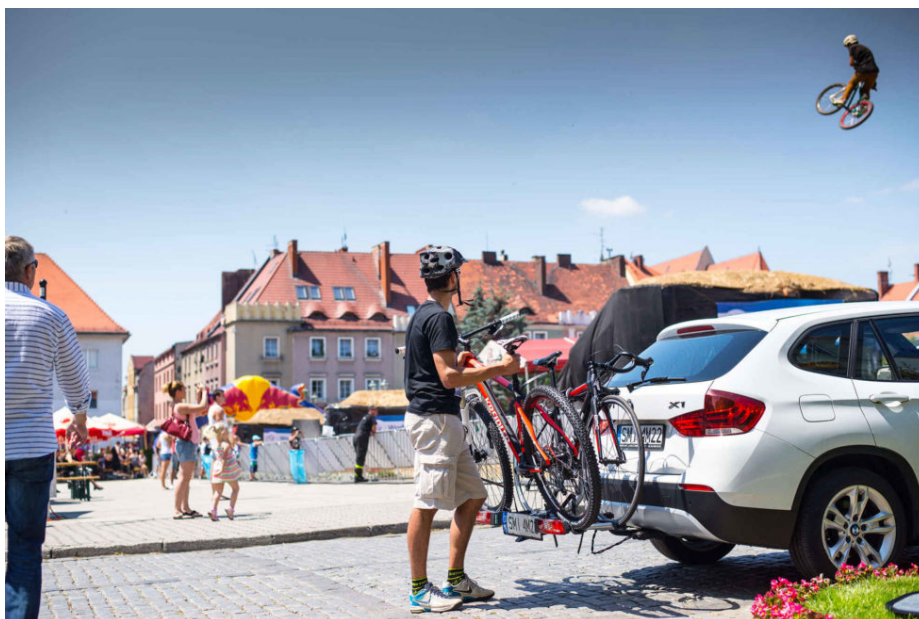
Rowerowe bagażniki na hak. Trzecia tablica legalna od 2016 roku

Sytuacja została unormowana z początkiem 2016 r. Pakiet rozporządzeń dotyczących tej sprawy miał wejść w życie – jak zapowiadał jeszcze poprzedni rząd – już w trakcie ostatnich wakacji. Ostatecznie jednak doszło do opóźnienia o kilka miesięcy.