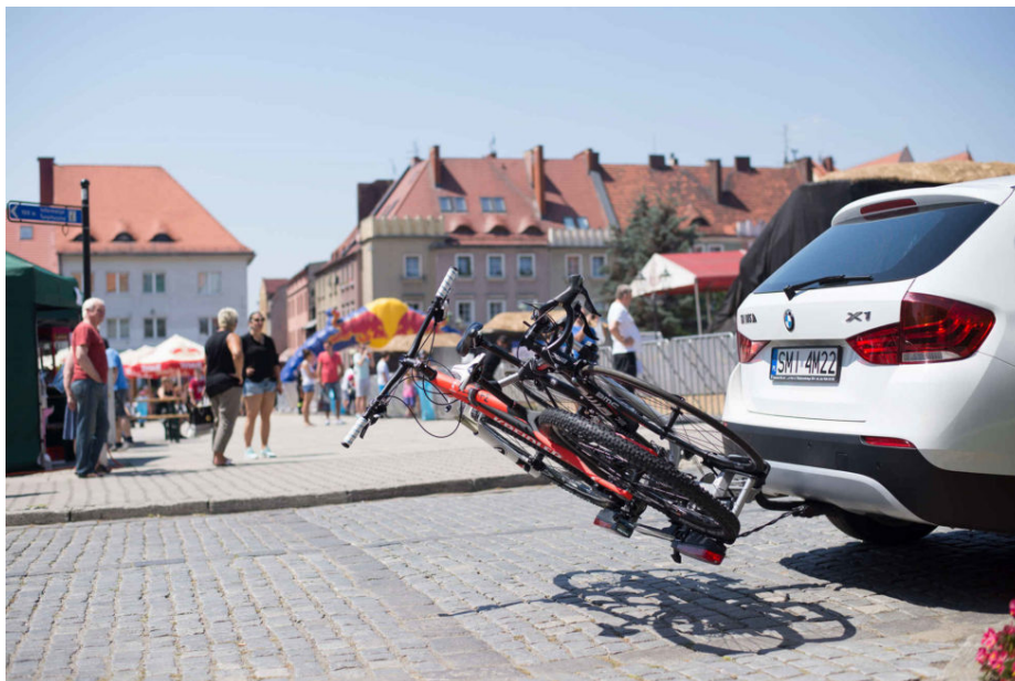
Rowerowe bagażniki na hak. Trzecia tablica legalna od 2016 roku

„Dodatkowa tablica rejestracyjna powinna być umieszczana na bagażniku w miejscu konstrukcyjnie do tego przeznaczonym i zgodna z obowiązującym wzorem. Do legalizacji tablicy będzie wydawany jeden komplet nalepek legalizacyjnych” – podaje resort infrastruktury i budownictwa.